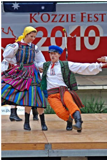
Zespół 'Lajkonik', Cooma, 2010

Z okazji świętowania wielokulturowości w Australii również lokalni Chińczycy z Cooma dołączyli się do Festiwalu.