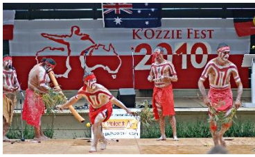
Zespół 'Monaro', Cooma, 2010.

Zespół 'Monaro' tradycyjnych tancerzy szczepu Ngarigo ponownie gościł na Festiwalu w 2010 r.