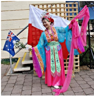
Folklor z Chin, 2008

Zespół 'Monaro' tradycyjnych tancerzy szczepu Ngarigo ponownie gościł na Festiwalu w 2010 r.